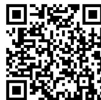
幻灯片模板 下载二维码