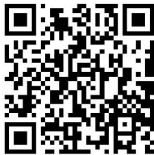
广西医学会风湿病学2023年 学术年会会议报名二维码